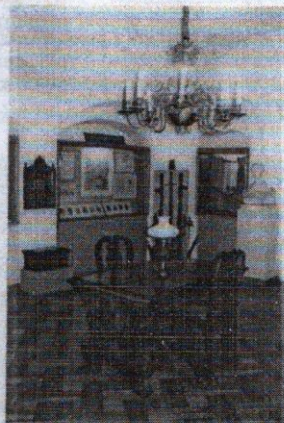
Fragment ekspozycji poświęcony najstarszej historii miasta

znaleziska i wykopaliska pochodzące z rejonu Gorlic (monety, narzędzia z epoki kamienia, herby i pieczęcie miasta, dokumenty i przedmioty należące do cechów krawieckiego i szewskiego, broń, w tym miecz katowski, meble pochodzące z dworów gorlickich).